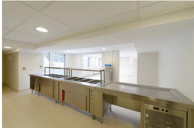
Une cuisine collective selon les normes en vigueur

Une cuisine collective équipée avec une salle de restauration attenante ouverte sur l'extérieur de la résidence, et dont la gestion sera assurée par une association par convention. La salle de restaurant s'ouvre et s'éclaire sur le jardin nord par un jeu de gradins paysagés.